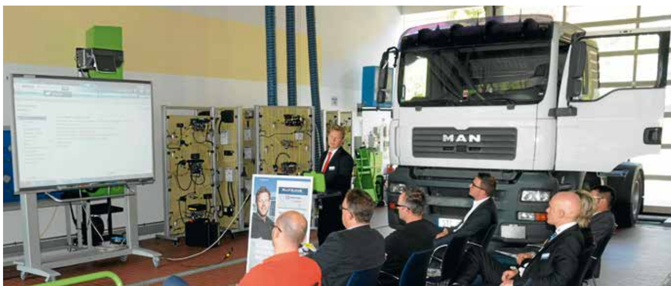
Alltrucks stellt sich vor: Das Werkstattkonzept von ZF, Bosch und Knorr-Bremse wächst kontinuierlich und gewinnt immer mehr neue Partner.

Bei Informationsveranstaltungen in Dortmund, Plochingen und Berlin hat sich das Werkstattkonzept Alltrucks möglichen neuen Partnern vorgestellt. Die interessierten Werkstätten konnten sich dabei über das Serviceangebot von Alltrucks informieren und in Live-Demonstrationen die Mehrmarken-Diagnose, die technischen Informationen und das Partner-Portal kennenlernen. Zahlreiche Teilnehmer nutzten die Möglichkeit,